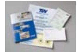
Umfangreiche Garantie/ Saris TÜV zertifiziert