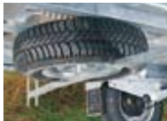
Ersatzrad mit Halter