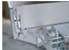
Winde mit herausnehmbare. Vorderwand