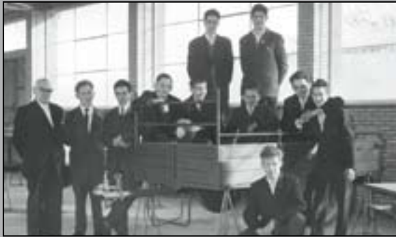
Serienfertigung von Anhängern seit 1959.