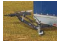
Höhenverstellbare Deichsel & DIN-Zugöse