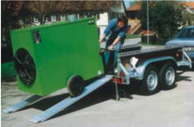
PK 2702 befahrbar durch Aluminium-Auffahrschienen Typ RL 2000 mm lang, 220 mm breit, Tragkraft lt. Prospekt Nr. 0.2.