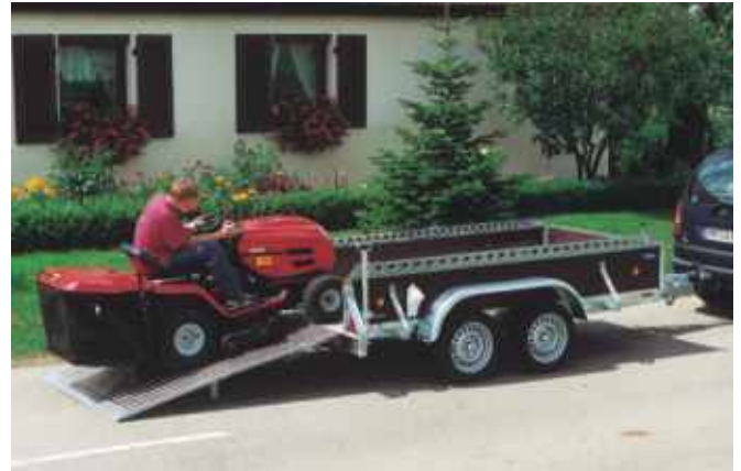
PKL 2702 ausgerüstet mit doppelt umklappbarer Laderampe, Lauffläche Siebdruck, Alu-Auffahrprofil, einschl. Rampenhebern mit Gasfedern und Rohrstützen mit doppelter Klemmhalterung. Bestens geeignet zum Befahren mit 3rädriigen Geräten.

» siehe Modellreihe PKL in Infobroschüre Nr. 22!