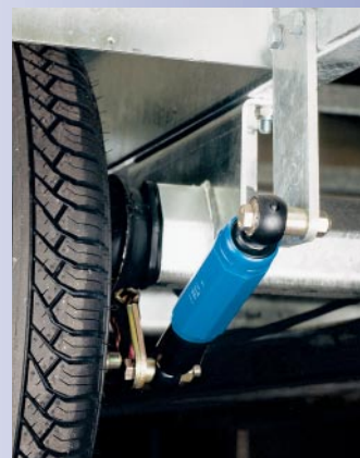
Achsstoßdämpfer montiert (Option)

matikstützrad. Es erleichtert das An- und Abkoppeln sowie das Rangieren des Anhängers. Die Aluminium Bordwände bieten neben dem geringen Gewicht noch einen Vorteil. Aluminium verfärbt sich nicht, auch nicht nach intensivem Gebrauch. Der Anhänger bleibt immer ansehnlich, hiermit kann man sich sehen lassen!