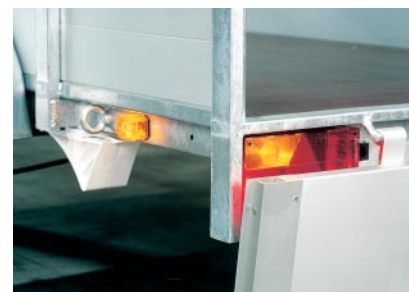
Beleuchtung sichtbar bei geöffneter Hinterbordwand

Außerdem ist man beim Entwurf davon ausgegangen, dass man gesehen werden soll, wenn die Rückwandklappe geöffnet ist. Muss man zum Beispiel im Dunkeln mit geöffneter Hinterbordwand laden, dann sind die Alarmleuchten trotzdem noch sichtbar. Mit diesem Anhänger werden Sie gesehen, und das gibt Sicherheit.