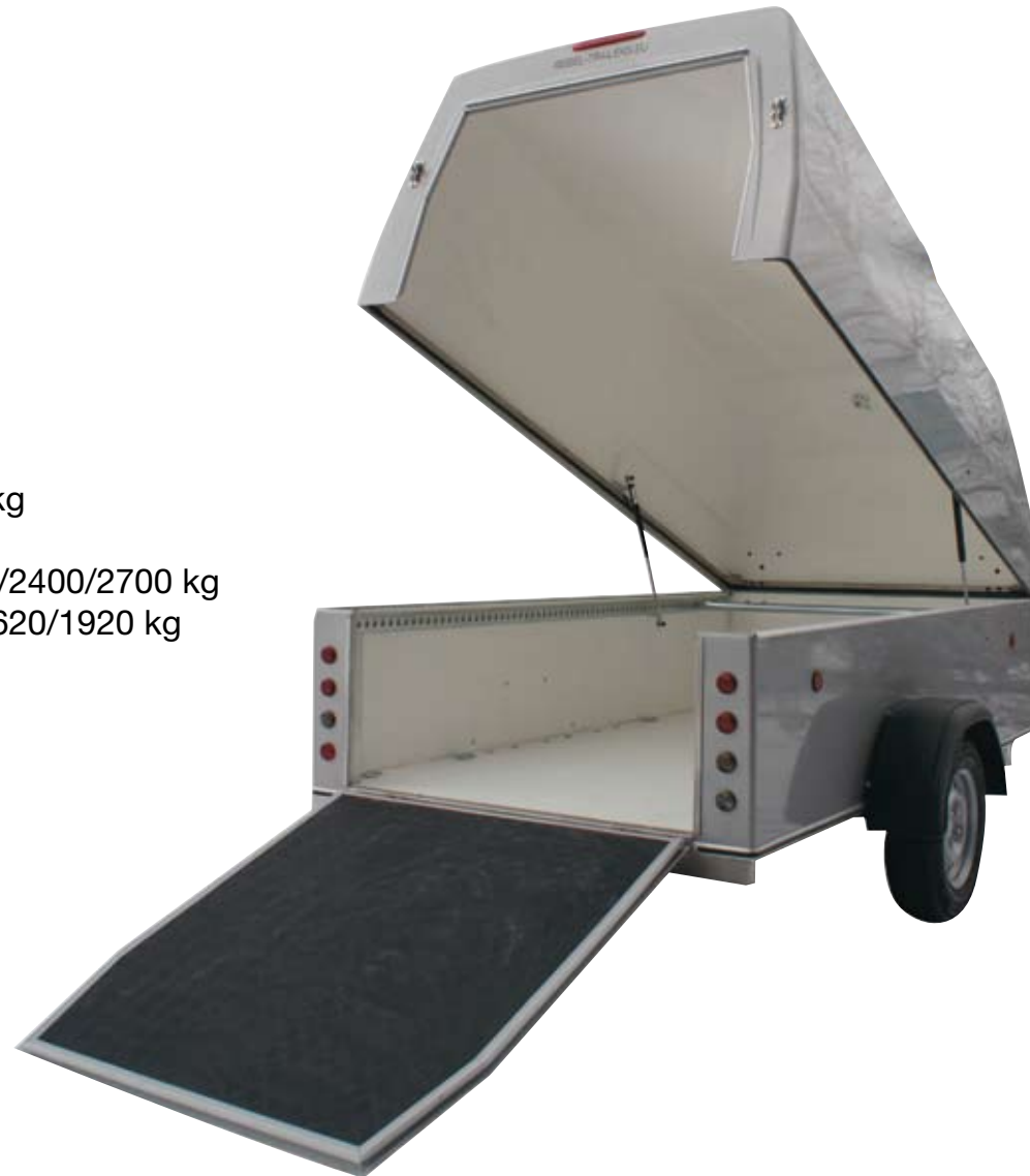
Abbildung: Nach Wunsch große Auffahrrampe.

Seitenwandhöhe des Unterbaus 40 bis 60 cm. Variante 'Eco' or 'Special'