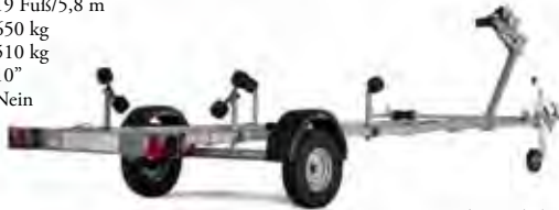
Stützrad ist Zubehör

Ges. Maße: 585x157 cm Max Bootslänge: 19 Fuß/5,8 m Ges. Gewicht: 650 kg Nutzlast: 510 kg Bereifung: 10" Bremse: Nein