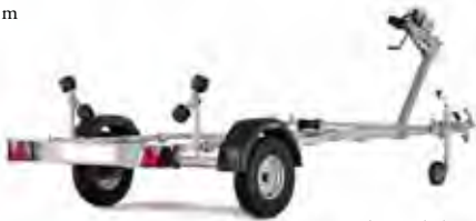
Stützrad ist Zubehör

Ges. Maße: 479x157 cm Max Bootslänge: 14 Fuß/4,2 m Ges. Gewicht: 500 kg Nutzlast: 375 kg Bereifung: 10" Bremse: Nein