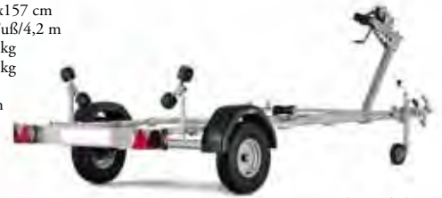
Stützrad ist Zubehör

Ges. Maße: 479x157 cm Max Bootslänge: 14 Fuß/4,2 m Ges. Gewicht: 600 kg Nutzlast: 480 kg Bereifung: 10" Bremse: Nein